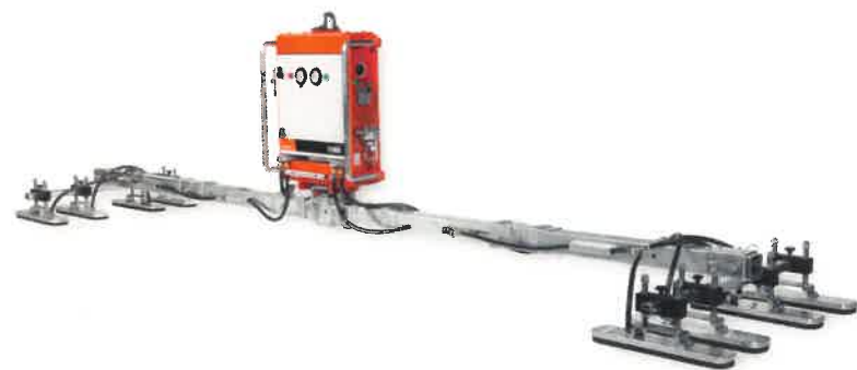
Configuration for roof panels

VACUUM LIFTING DEVICE FOR ROOF- AND WALL PANELS